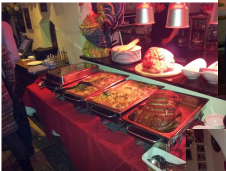
Herbstfest am 9.11.2012 in Haus Daufenbach