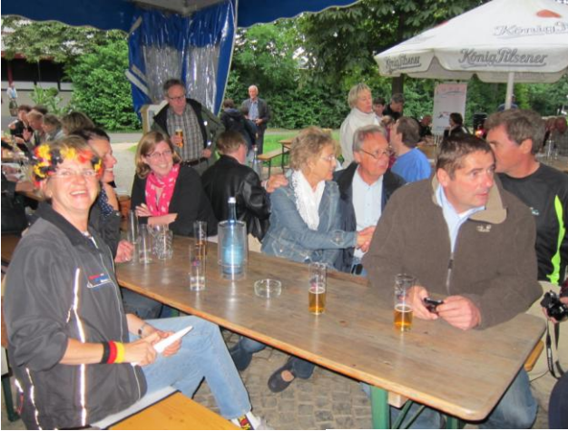
Sommerfest am 29.06.2012 am Blauen Affen